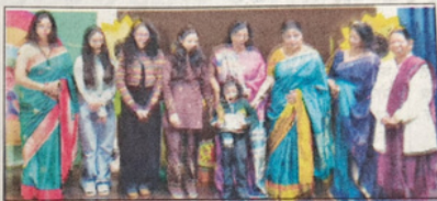
नन्ही छात्रा को प्रमाण पत्र देते अतिथि।

हरिद्वार, 13 दिसम्बर (अमरीश): डीपीएस दौलतपुर जूनियर कनखल द्वारा अंतर-विद्यालय प्रतियोगिता 'आगाज सप्तरंग-2025' का भव्य आयोजन किया गया। प्रतियोगिता में 15 विभिन्न विद्यालयों के विद्यार्थियों ने भाग लेकर अपनी रचनात्मकता और प्रतिभा का प्रभावशाली प्रदर्शन किया। कार्यक्रम के अंतर्गत नर्सरी से कक्षा तीन तक के विद्यार्थियों के लिए अलग-अलग रचनात्मक प्रतियोगिताएं आयोजित की गईं। नर्सरी कक्षा के लिए ड्रॉइंग इन कलर्स, एलकेजी के लिए डॉट्स एंड कलर, यूकेजी के लिए कोलाज आर्ट, कक्षा 1 के लिए क्राउन क्रेज, कक्षा 2 के लिए मिनी एंड गुरुस, कक्षा 3 के लिए नारी शक्ति-द पावर ऑफ वूमैन