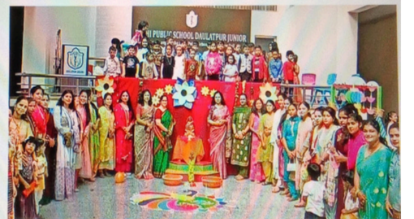
डीपीएस दौलतपुर जूनियर कनखल में दीपावली मनाते शिक्षक और छात्र-छात्राएं

जागरण संवाददाता, हरिद्वार: डीपीएस दौलतपुर जूनियर, कनखल में दीपावली का पर्व हर्षोल्लास और उत्सव के साथ मनाया गया। इस अवसर पर विद्यालय परिसर को रंग-बिरंगी सजावट, दीपकों और रंगोलियों से सजाया गया। कार्यक्रम में अभिभावकों और छात्र-छात्राओं ने संयुक्त रूप से भाग लेकर दीपावली की सांस्कृतिक भावना को जीवंत किया।