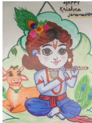
Kavish Class - Prep Sr.