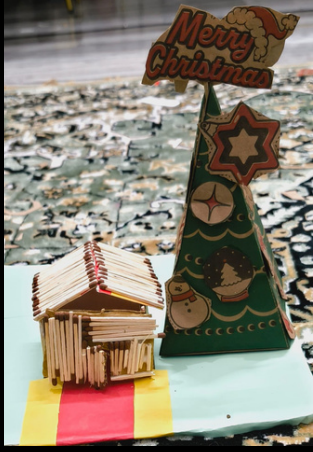
Dakshit Class - Prep Sr.