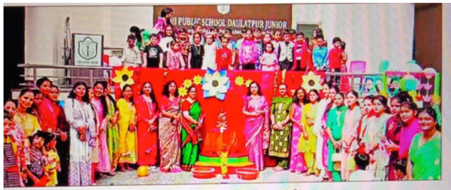
दीपोत्सव पर सांस्कृतिक टोली की निकली भव्य झंझकी।